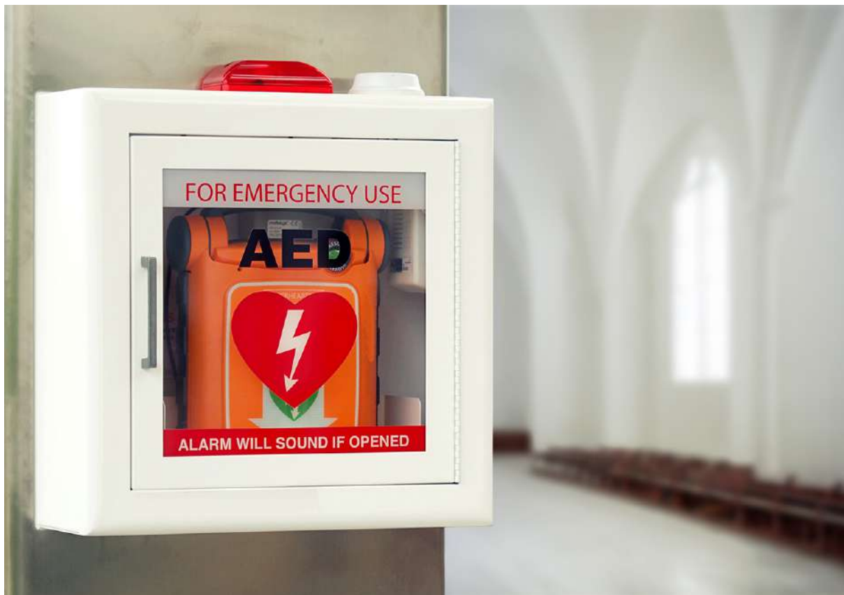
Rafal Kowalczyk based on © tpa8228, © Iakov Kalinin, Adobe Stock