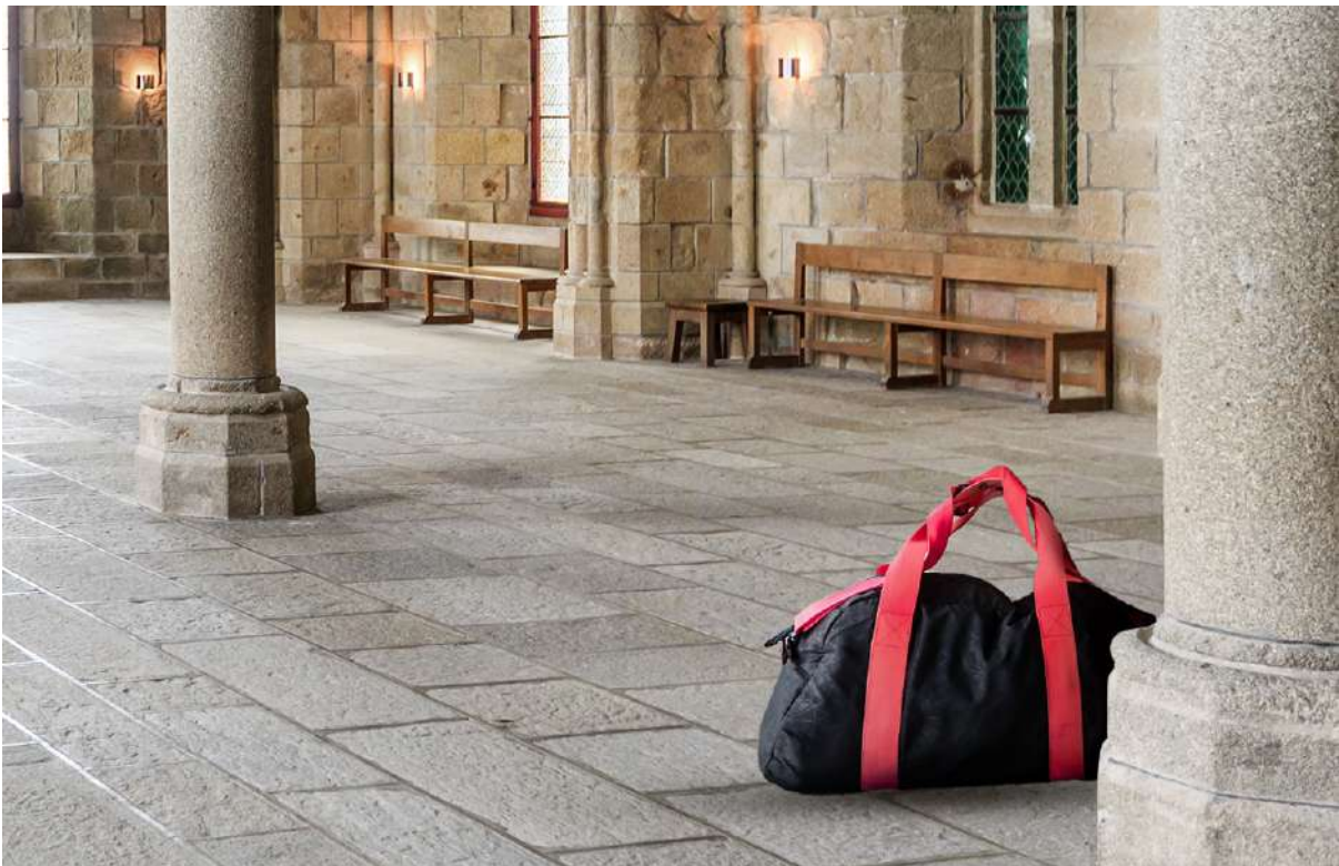
Rafał Kowalczyk based on © pigprox, Adobe Stock