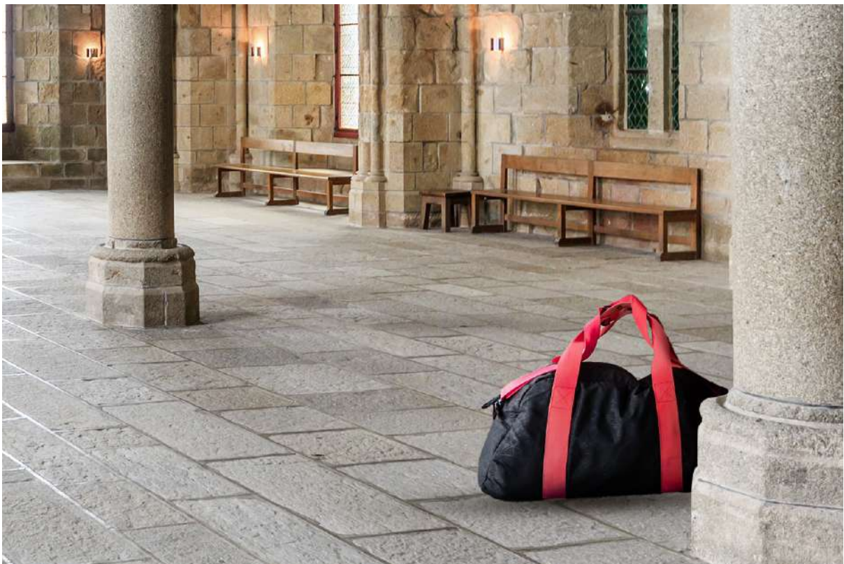
Rafal Kowalczyk based on © pigprox, Adobe Stock